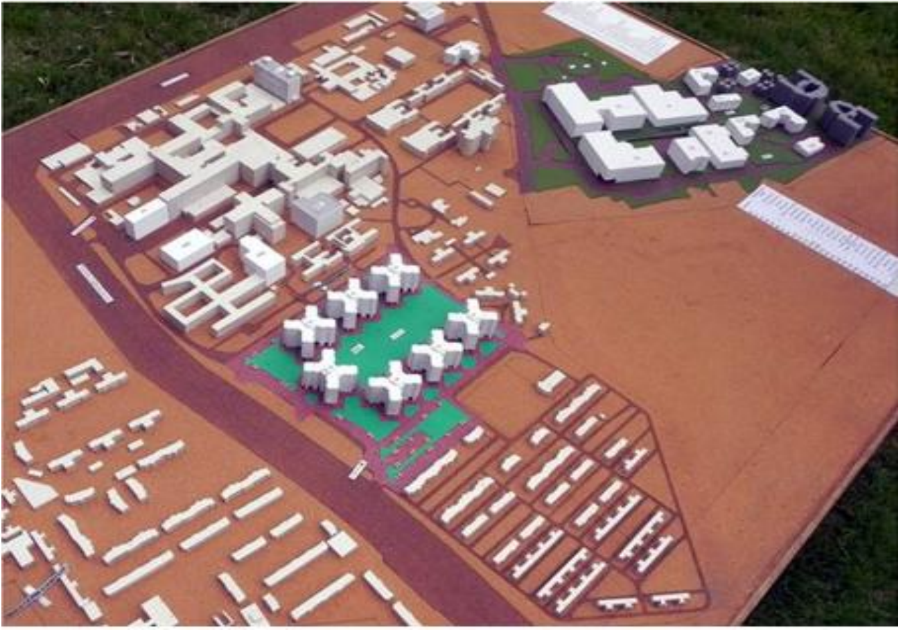
अ खल भारतीय आयुर्वज्ञान संस्थान समग्र परिसर पुनर्विकास - ब्लॉक मॉडल