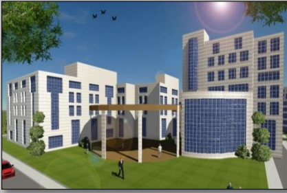
पीसी टी चंग ब्लॉक