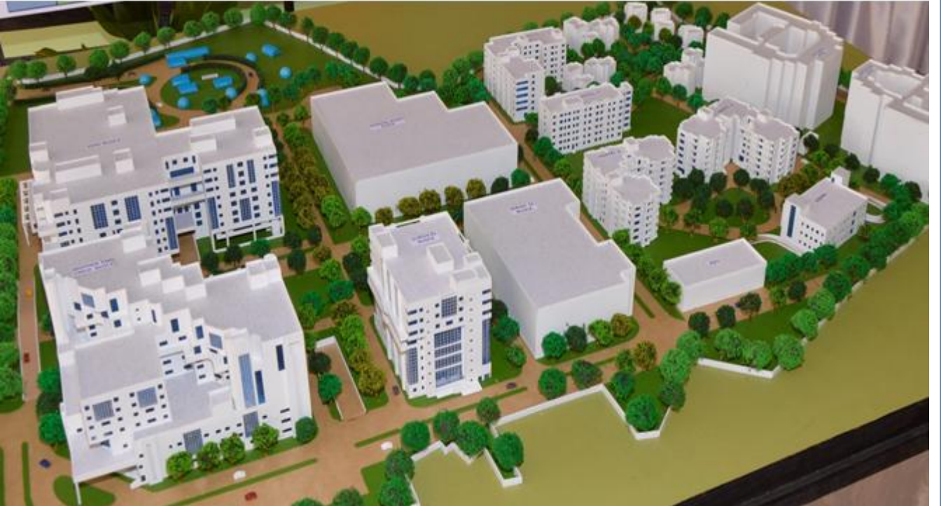
अ खल भारतीय आयुर्वज्ञान संस्थान मस्जिद मोठ क्षेत्र पुनर्विकास - ववरण मॉडल